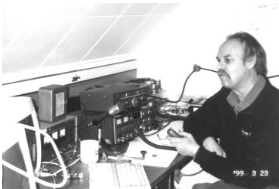
Magnus SM7HGY kör test på 50 MHz från klubben.